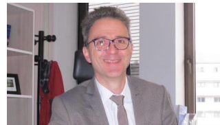
La CPAM d'Indre-et-Loire parmi les bons élèves