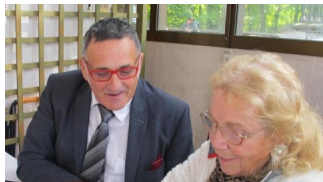
Se préparer aujourd'hui au vieillissement de demain